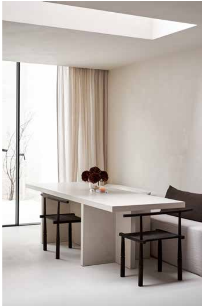
Van boven naar onder: Natuurlijk licht stroomt binnen via een nieuw geplaatste koepel. Bad uit klei van Studio LoHo.